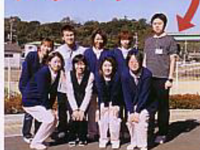
六尾だよりのご感想 お待ちしております。