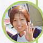
K (ヘルパーステーション)

あなたの声を聞かせて下さい。その声に応えていきたい。苦情・提案等、委員一同解決するために取り組んでいきます。