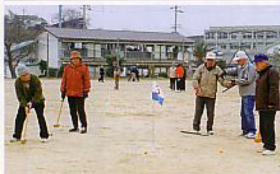
ねらいをすまし、ホールポストめがけて緊張の一瞬！

“生涯スポーツ”ーだれもがそれぞれの体力や年齢、目的に応じていつでも、どこでも楽しむことのできるスポーツーその代表格、世代をこえて楽しめる、人気上昇中の「グラウンドゴルフ」に密着しました。