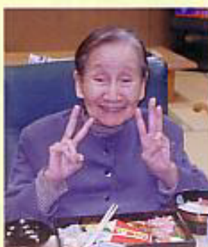
とうござり?! この笑顔

A 見ためも大事やけど、心の中も美しくいること、にっこしていれば心も美しくなれるよ。