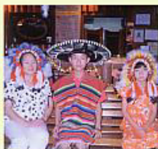
ガアムにてお祝さんと

A 昔は日本人形の着物を仕事をしながら作ったり、ゲームホールを主人と一緒に楽しんでいます。