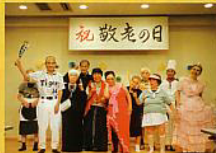
敬老会 (ファッションショー)